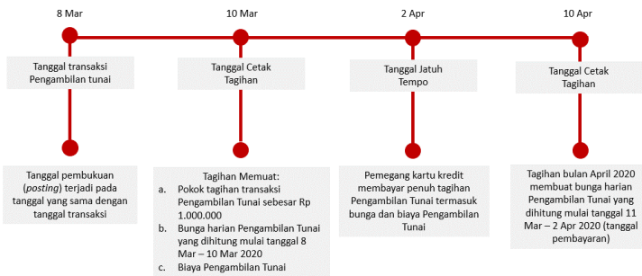
Ilustrasi Perhitungan Bunga Transaksi Tarik Tunai (Cash Advance)

Bunga untuk Pengambilan Tunai (Cash Advance) dibebankan dan dihitung sejak Tanggal Penarikan (Cash Advance) sampai dengan tanggal dilakukannya pembayaran penuh dari transaksi Pengambilan Tunai tersebut. Suku bunga yang berlaku untuk transaksi Pengambilan Tunai tercantum pada Lembar Penagihan. Biaya, denda, ataupun bunga yang belum dibayarkan tidak termasuk dalam komponen perhitungan bunga. Untuk perhitungan bunga secara lengkap dapat dilihat pada ilustrasi Perhitungan Bunga Kartu Kredit.