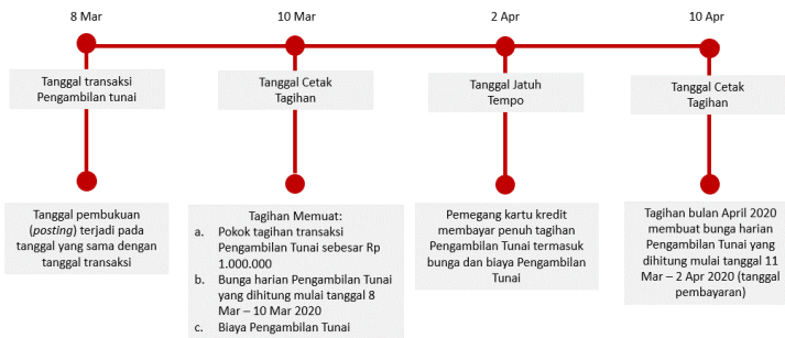
Ilustrasi Perhitungan Bunga Transaksi Tarik Tunai (Cash Advance)

Bunga untuk Pengambilan Tunai (Cash Advance) dibebankan dan dihitung sejak Tanggal Penarikan (Cash Advance) sampai dengan tanggal dilakukannya pembayaran penuh dari transaksi Pengambilan Tunai tersebut. Suku bunga yang berlaku untuk transaksi Pengambilan Tunai tercantum pada Lembar Penagihan. Biaya, denda, ataupun bunga yang belum dibayarkan tidak termasuk dalam komponen perhitungan bunga. Untuk perhitungan bunga secara lengkap dapat dilihat pada ilustrasi Perhitungan Bunga Kartu Kredit.