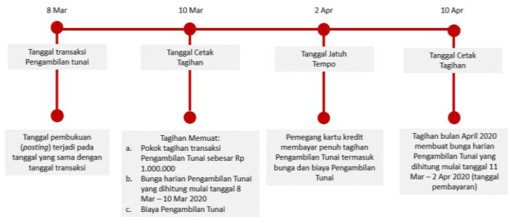
Ilustrasi Perhitungan Bunga Transaksi Tarik Tunai (Cash Advance)

Bunga untuk Pengambilan Tunai (Cash Advance) dibebankan dan dihitung sejak Tanggal Penarikan (Cash Advance) sampai dengan tanggal dilakukannya pembayaran penuh dari transaksi Pengambilan Tunai tersebut. Suku bunga yang berlaku untuk transaksi Pengambilan Tunai tercantum pada Lembar Penagihan. Biaya, denda, ataupun bunga yang belum dibayarkan tidak termasuk dalam komponen perhitungan bunga. Untuk perhitungan bunga secara lengkap dapat dilihat pada ilustrasi Perhitungan Bunga Kartu Kredit.