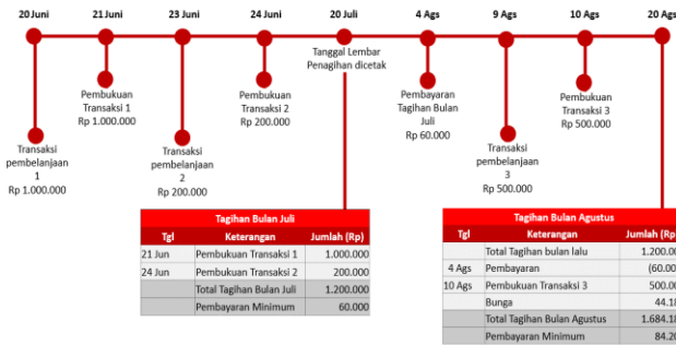
Ilustrasi Perhitungan Bunga Transaksi Pembelanjaan (Ritel)

Bunga akan dikenakan jika Pemegang Kartu membayar kurang dari total tagihan baru, atau membayar setelah Tanggal Jatuh Tempo. Bunga untuk Transaksi Pembelanjaan dihitung berdasarkan Tanggal Pembukuan (Posting Date) dari transaksi yang dilakukan. Suku bunga yang berlaku untuk transaksi pembelanjaan tercantum pada Lembar Penagihan. Biaya, denda, ataupun bunga yang belum dibayarkan tidak termasuk dalam komponen perhitungan bunga. Bunga akan ditagihkan pada lembar penagihan berikutnya. Untuk perhitungan bunga secara lengkap dapat dilihat pada ilustrasi perhitungan bunga Kartu Kredit.